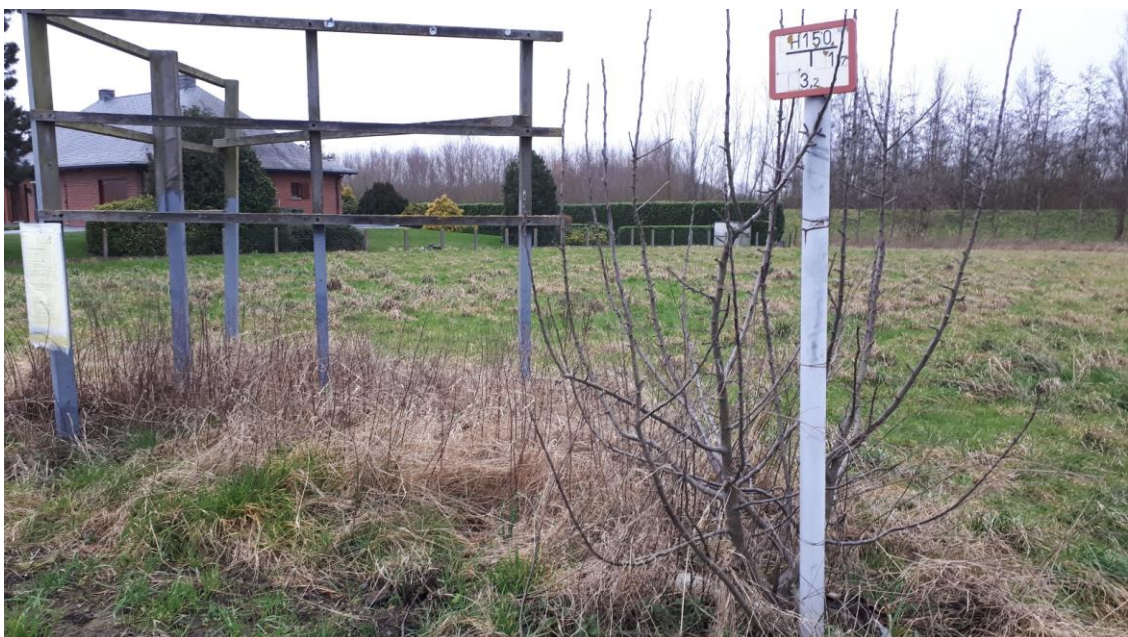
Moederboom van de appel 'Haagem' (Oudegem, 31-01-2022). Het terrein stond op het punt verkaveld te worden.