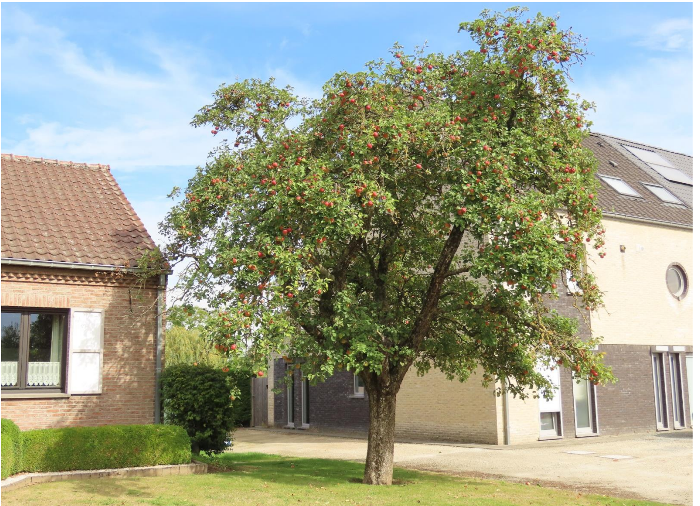
100-jarige Pië Baron, de enige gekende volwassen boom van zijn ras. (Droeshout, september 2022)