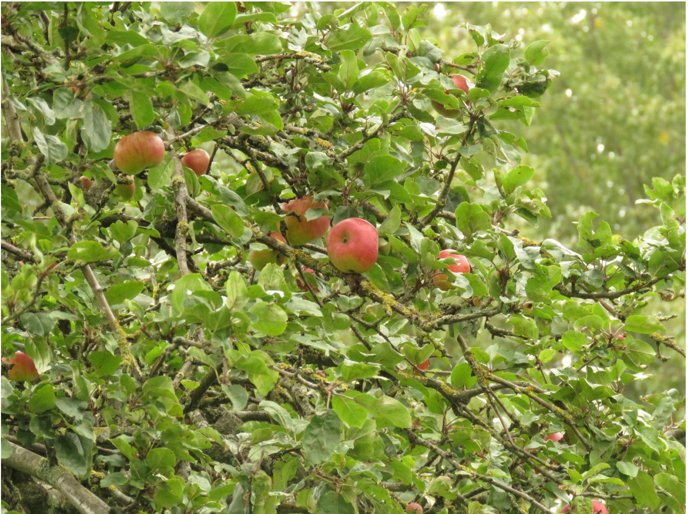
Oude boom in boomgaard 'Reinges' te Hezijde (Lebbeke)