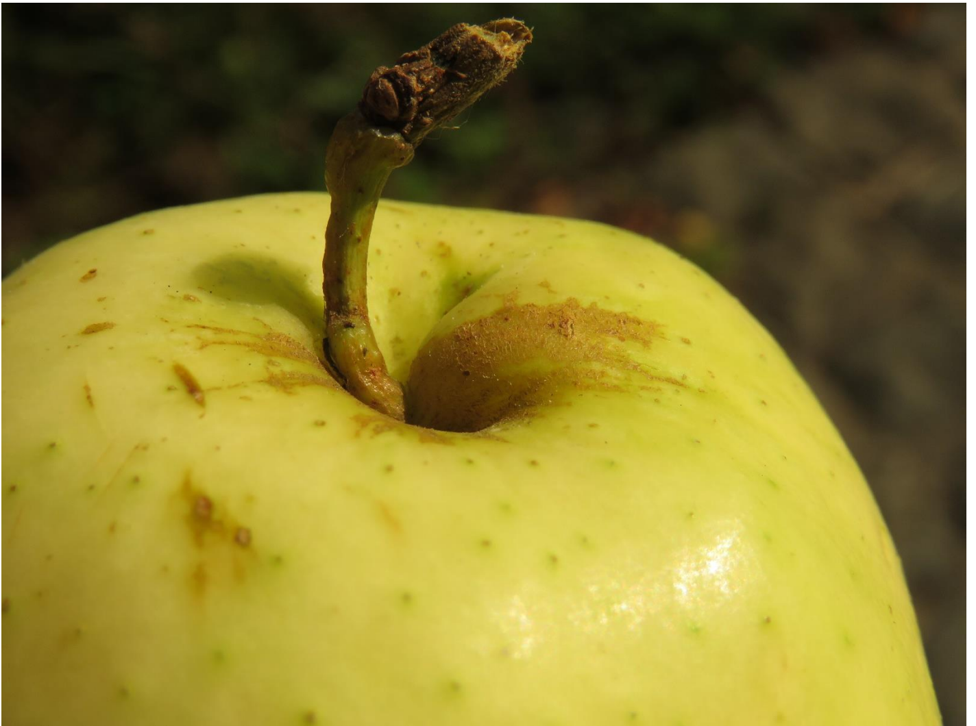
De vreemde knobbel in de steelholte van sommige vruchten