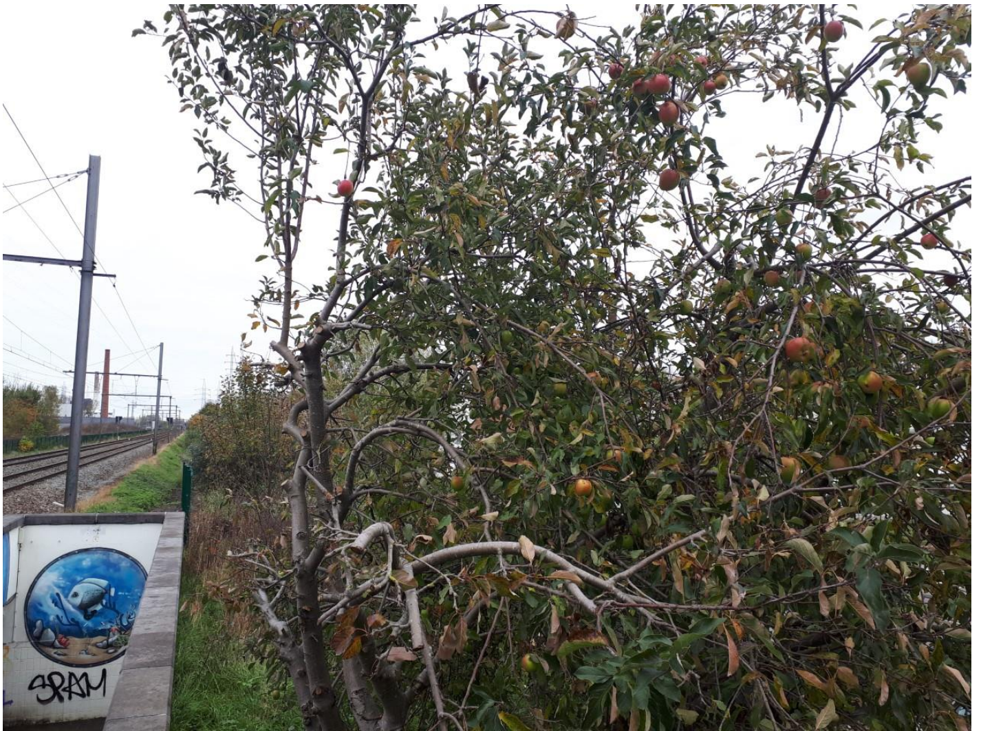
Moederboom aan voetgangerstunnel in Erembodegem (Aalst). Op 31 oktober 2020 waren deze vruchten nog niet rijp.