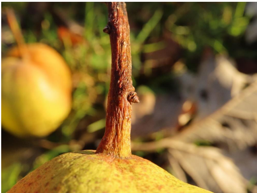
Detail van de knopjes op de vruchtsteel

Project fruitvondelingen Dender- en Scheldestreek