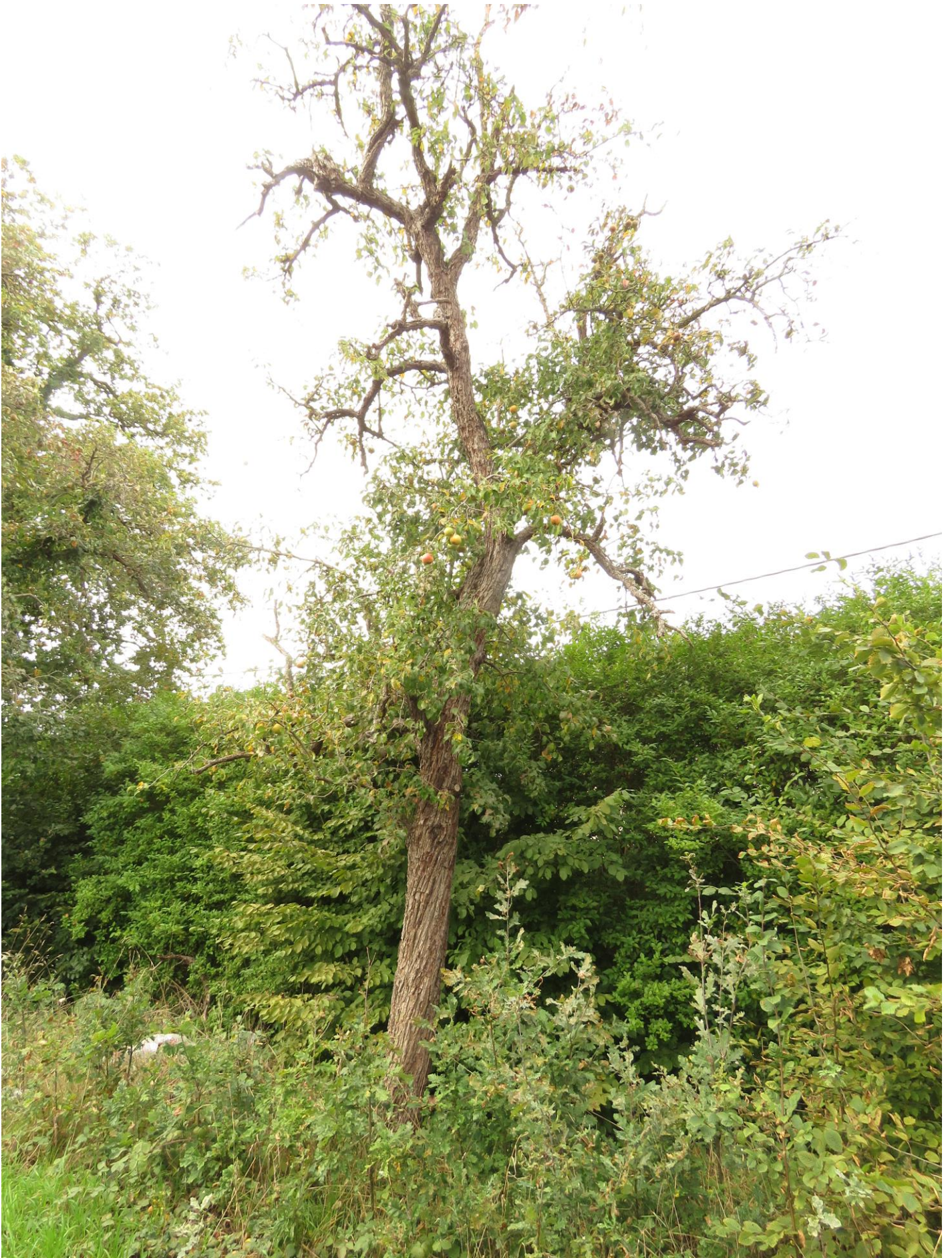
Oud exemplaar van Bretanjekes te Schoonaarde (Dendermonde).