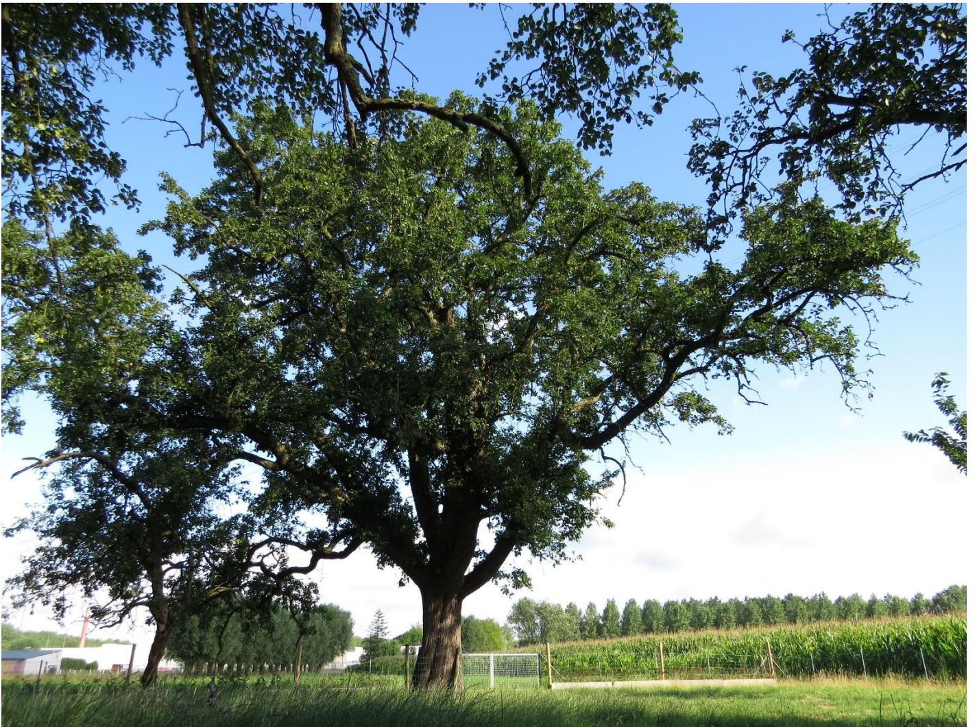
Oude, breed uitgroeiende Canadaperenlaar te Sint-Gillis (Dendermonde).