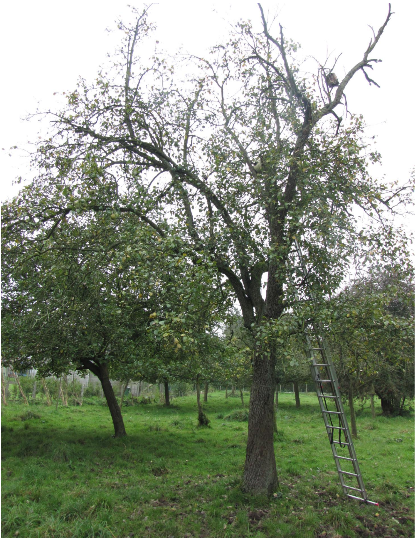
Oud exemplaar Ganzebollen te Nieuwerkerke (Aalst).