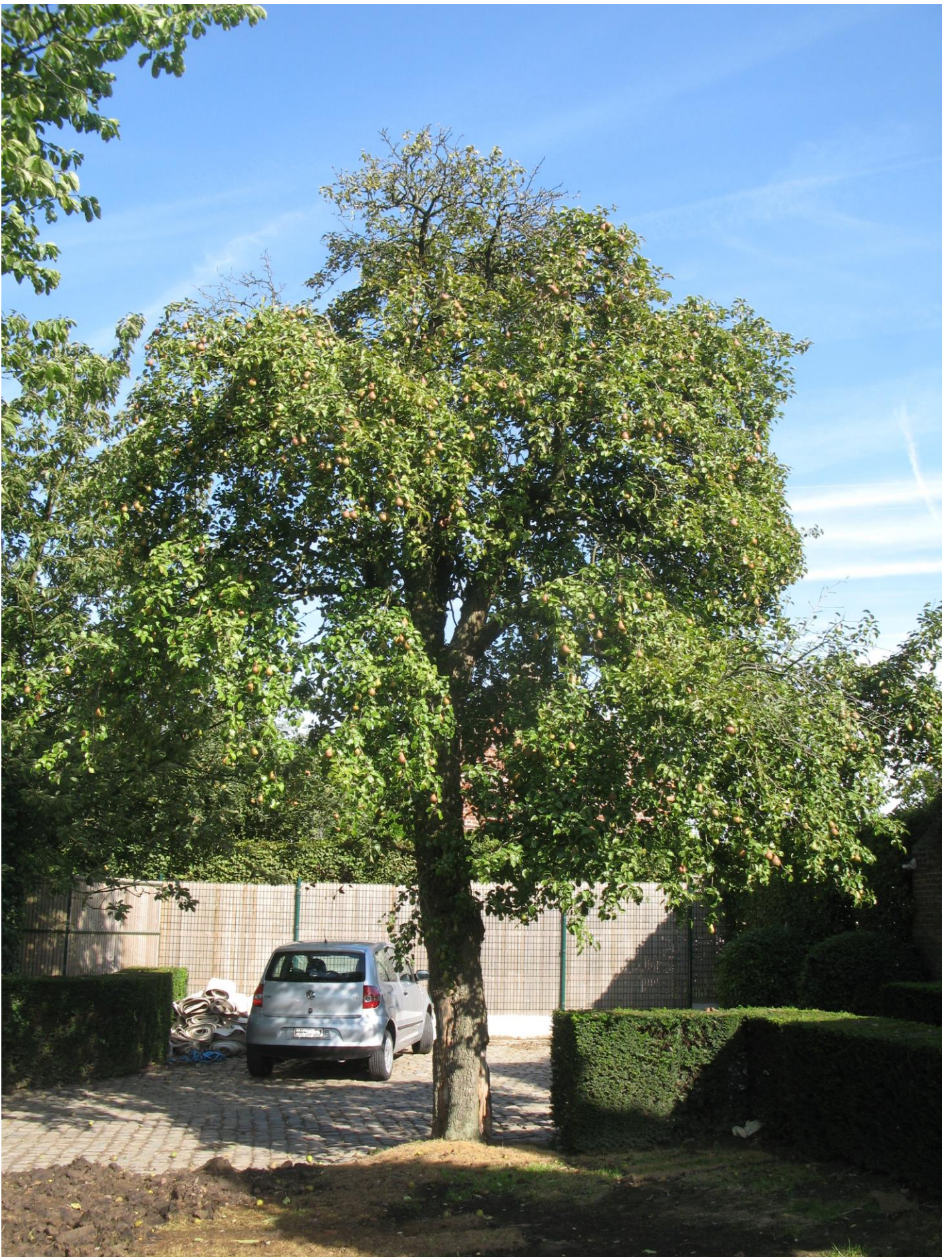
Oud exemplaar van Pistoolpeer te Denderhoutem. Deze boom werd in 2014 tijdens een herfststorm ontworteld.