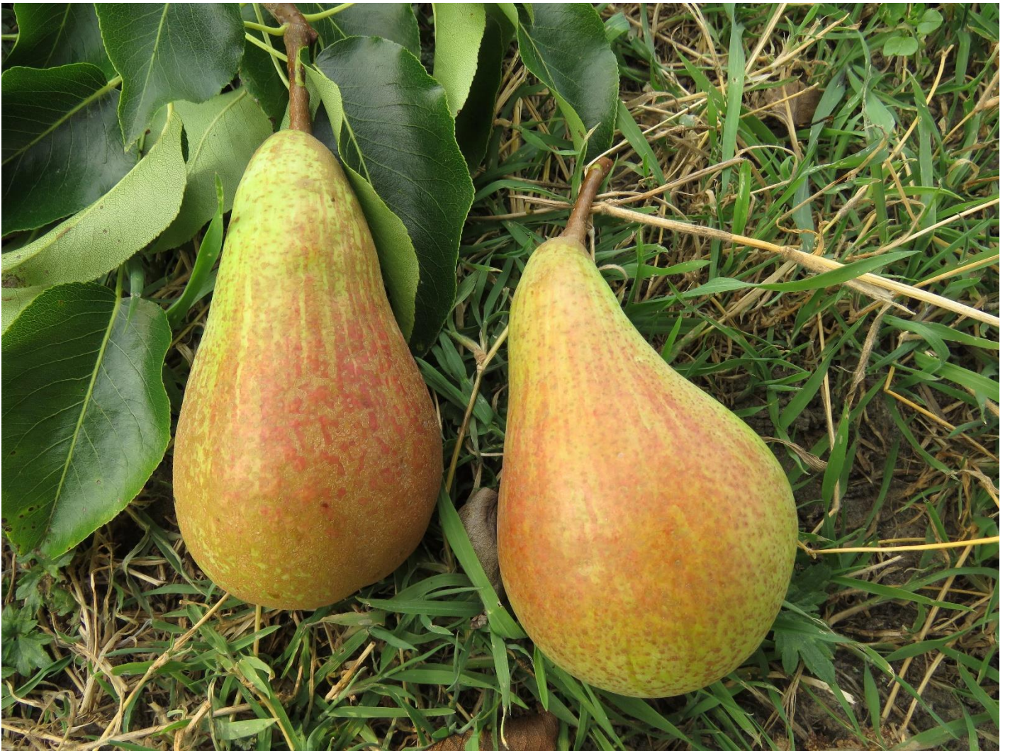
De rode blos is lang niet altijd aanwezig.