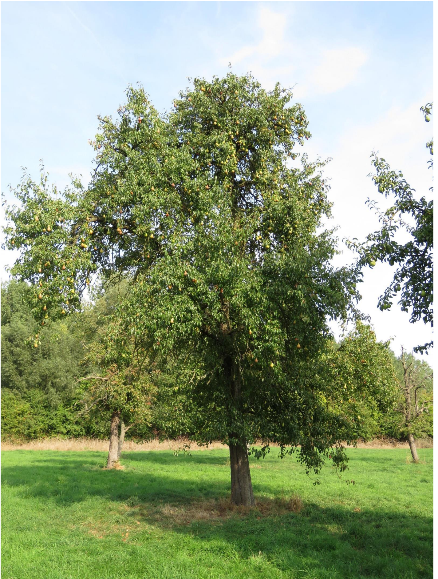
Oude Winterkeizerin te Hezijde (Lebbeke).